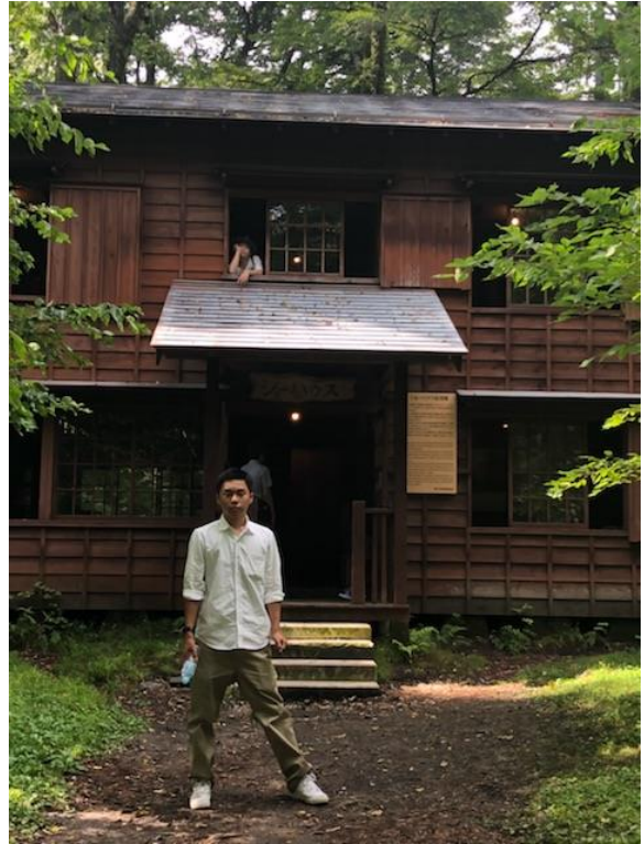
ショーハウス（軽井沢別荘一号）