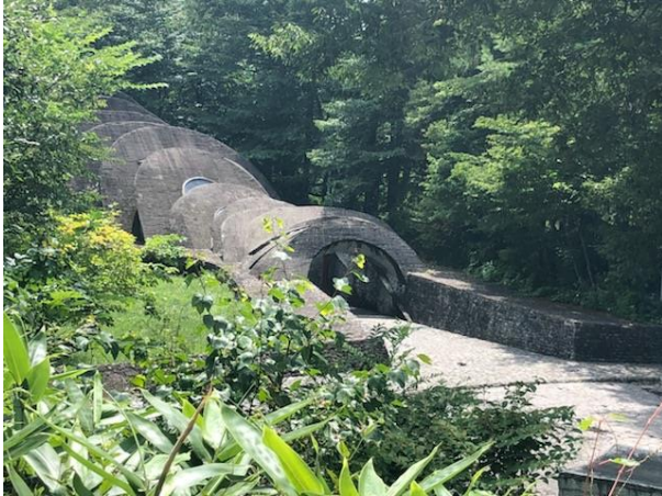
石の教会（挙式中のため外観のみ）

建築部では、建築に対する感性を高めるために夏の避暑地『軽井沢・中軽井沢』の著名な教会・別荘・ホテル等の建物や街並みを自転車でめぐり見学してきました。