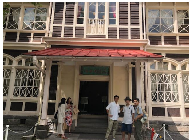
旧三笠ホテル（正面入口）