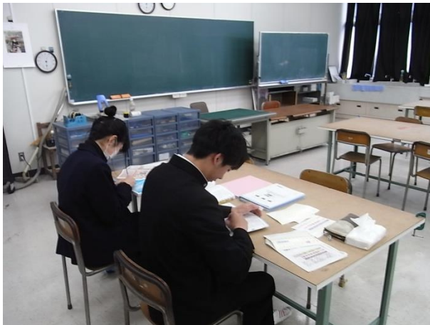
法令集ライン引き

I 法令集のライン引き 建築士試験は法令集が持ち込み可能なので過去に出題された部分にマーカー等でラインを引く作業をおこないます。