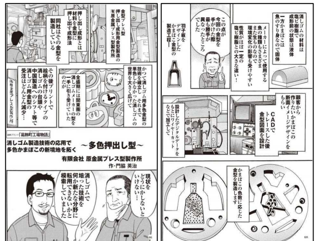
町工場物語という漫画になっています