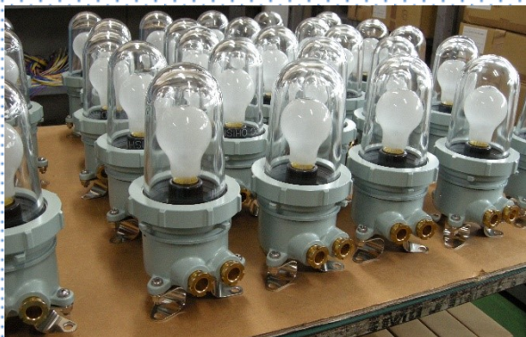
当社主要製品（一例）

当社の主要製品は、防衛省や海上保安庁で使用されている艦船や船舶の照明を中心とした電気機器です。90 年以上の歴史が語る通り、取引先からの信頼も厚く、これからも弛まぬ努力を続けて 100 年、150 年先を目指します。