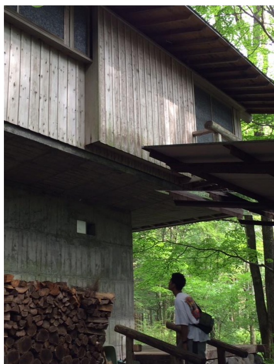
軽井沢の山荘（吉村順三）