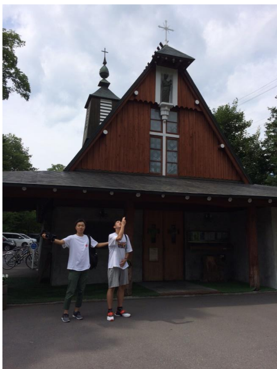
聖パウロカトリック教会（A・レーモンド）