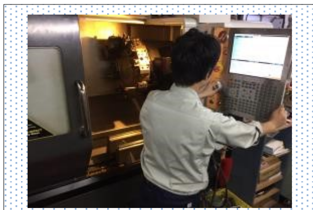
CNC 旋盤、マシニング加工様子