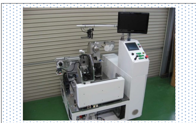
当社製品の一例 : JAXA 向け FOG 巻線機

当社は、創業 87 年（創業昭和 5 年）の会社です。創業当時は金属プレス の 深絞り加工を得意とし傘部品を製作する会社で生まれました。現在では、工場の自動化を担うエンジニアリング会社として、自動車メーカー、製薬メーカー、航空宇宙産業、JAXA やロボット産業などにロボットシステムやファクトリーオートメーションと言われる自働機械を納入しております。