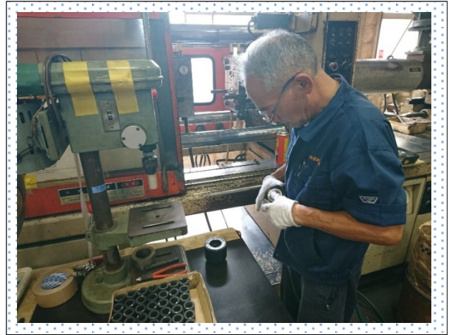
【射出成形作業の様子】