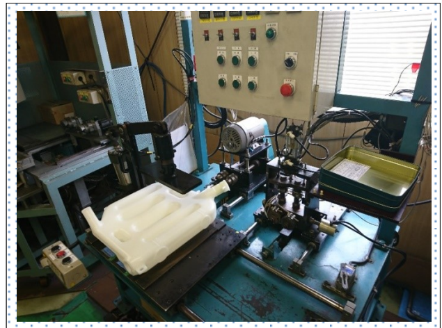
【自社開発加工機による組立作業の様子】