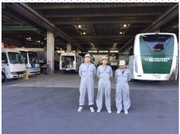
工場1階入口 先輩社員