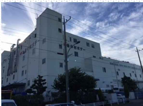
本社・若洲工場全景