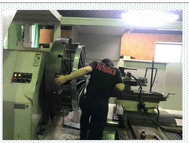
旋盤加工の作業様子