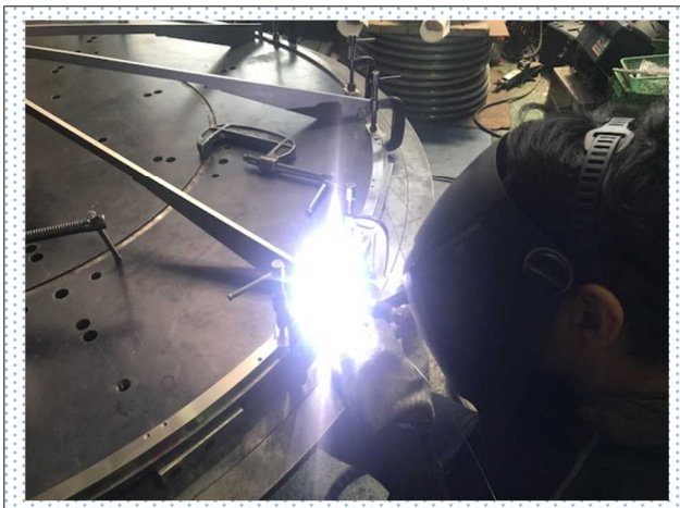
溶接作業中の様子