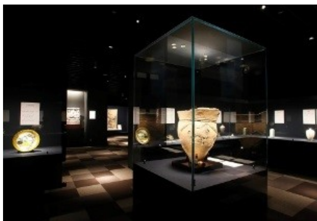
我が社が実際に作った展示ケース