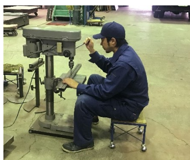
1階 工場風景① (ボール盤での穴あけ)