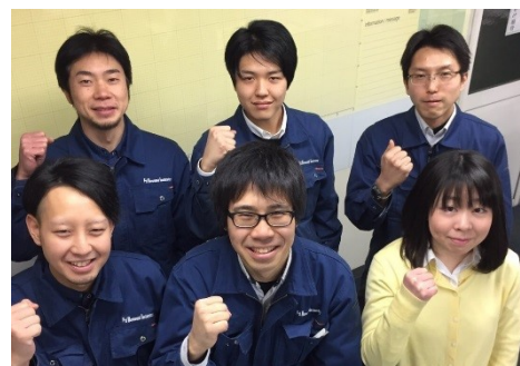
私たちと一緒に働きましょう！