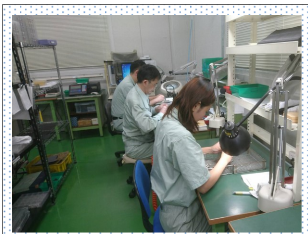
第2工場 製品工程検査風景