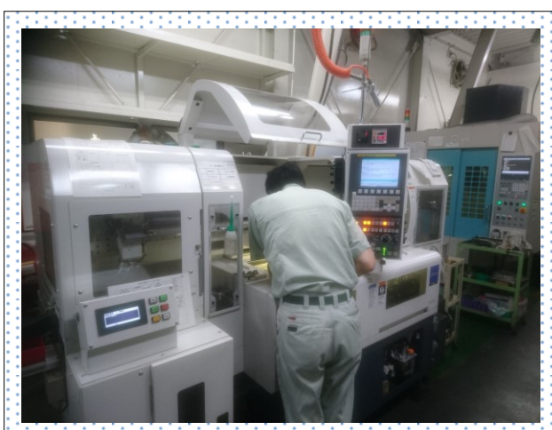
本社工場 セッティング風景