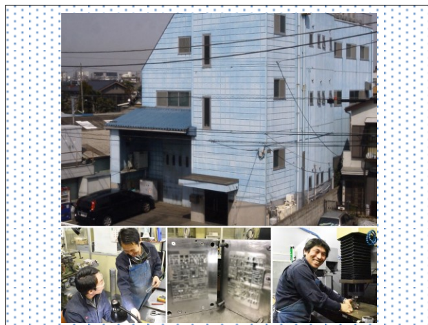
<当社外観、作業現場の様子など>