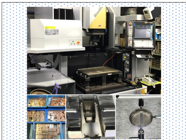
<使用機械、加工例など ②>