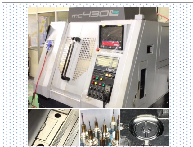
<使用機械、加工例など ①>