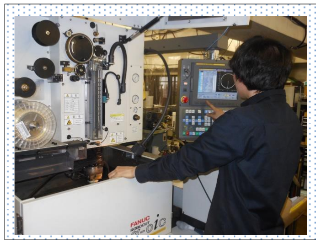
ワイヤーカット作業