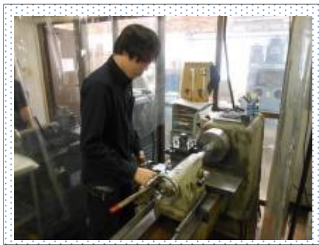
汎用普通旋盤作業