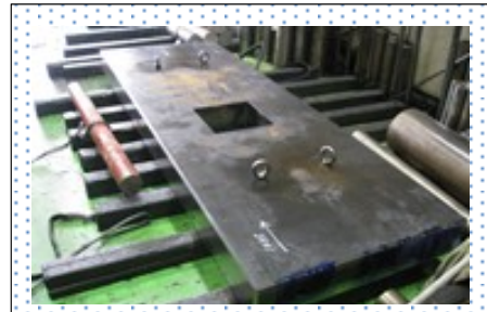
反射炉ジャケット原子力冷却装置 900×120t×2250L φ50 の冷却回路穴