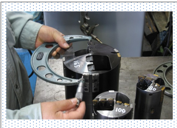
ガイド、切れ刃の加工寸法セットの様子 セットは 1/100 以内に調整が必要