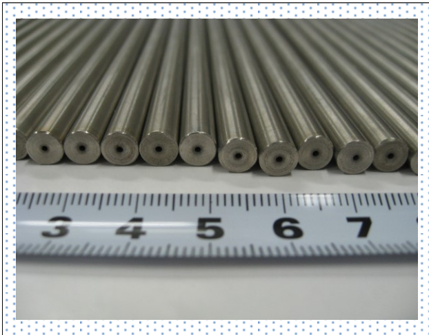
SUS316L φ1.0×325L 通し 極細孔加工。当社独自の技術

※アルミダイキャストとは、アルミ金型にて铸造した製品。 製品例) 車のエンジンヘッドカバー、釣り竿のリール等。