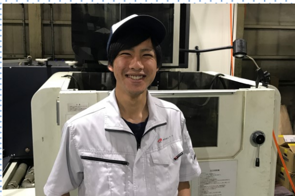
ワイヤ放電加工機の様子② 意外と簡単！