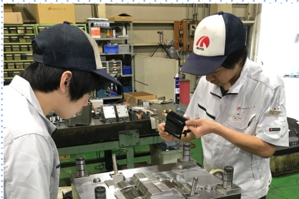
金型検査の様子③ ここは一丁腕の見せ所。