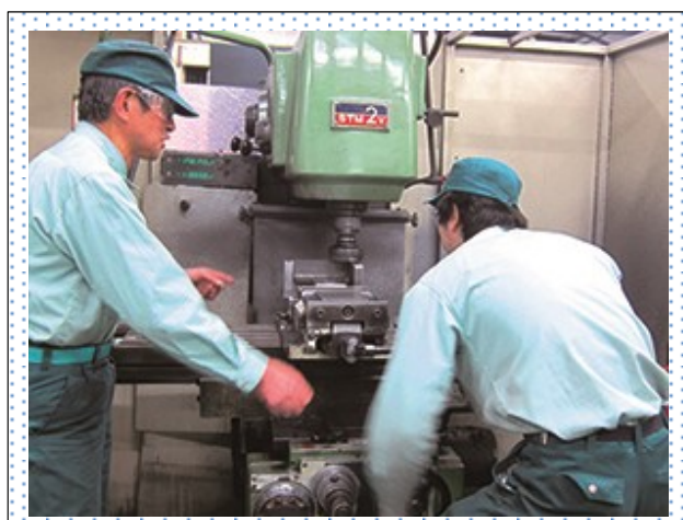
ベテランからものづくりの基本を学ぶ