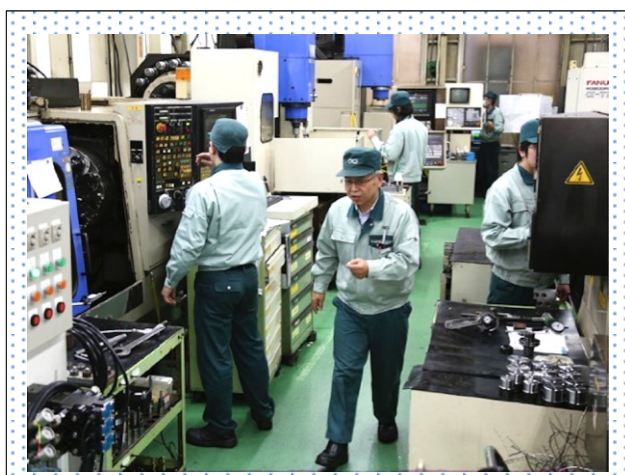
製造現場は汎用機から NC 機まで。。