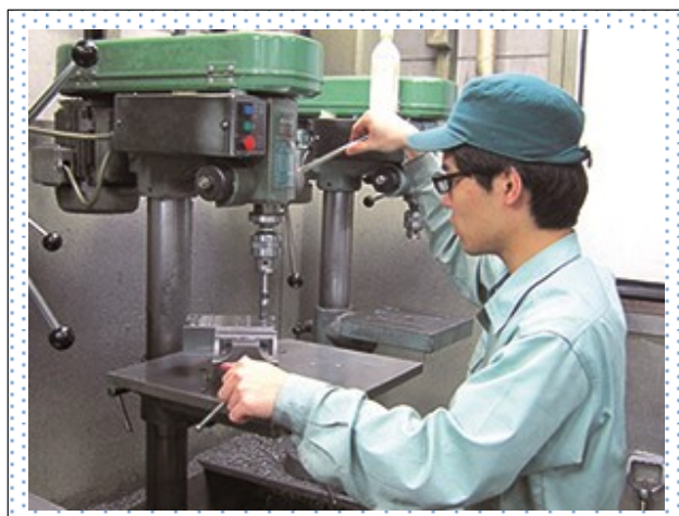
最初は汎用機で加工の基礎を学ぶ