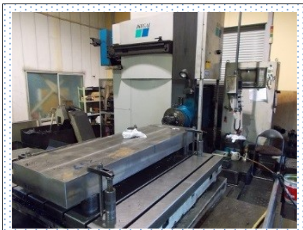
テーブル型横中ぐり盤