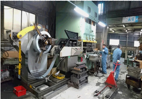
コイル状の材料を平坦に直し、一つの金型で 抜き、曲げ、絞りの成型をしています