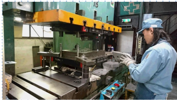
絞ったものに異常がないか確認しています ちなみに工業高校卒業生です