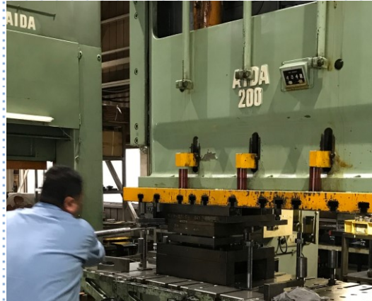
金型の取り付けをしています