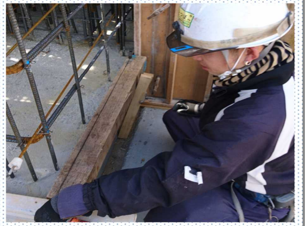
作業現場の様子 【墨だし】