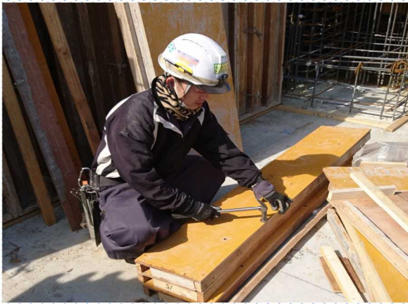
作業現場の様子 【パネル加工】

当社は、建設の企画・設計・施工・リニューアルリノベーション工事・型枠大工工事の総合建設業です。今回体験して頂く 型枠工事 はコンクリートの建物を形成する為の枠を作ることです。鉄筋で作られた建造物の骨組に、コンクリートを流し込むために、木板やベニヤ板を組み立て、器を作成して躯体形状を確立させます。こうした型枠を組み上げ、コンクリート製の建物を形成する工事を『 型枠工事 』と言います。これ作る技術者を 型枠大工技術者 と呼びます。