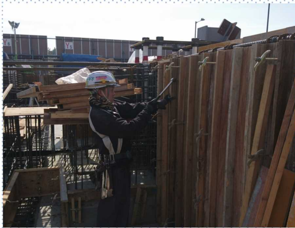
作業現場の様子 【パネル取り付け】