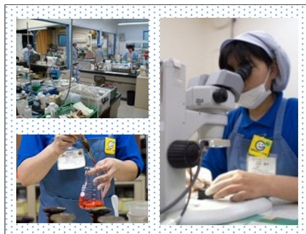
常に新しい価値を創造する開発・研究の取組み