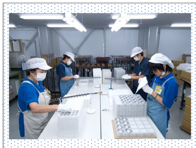
作業現場の様子：検査部門