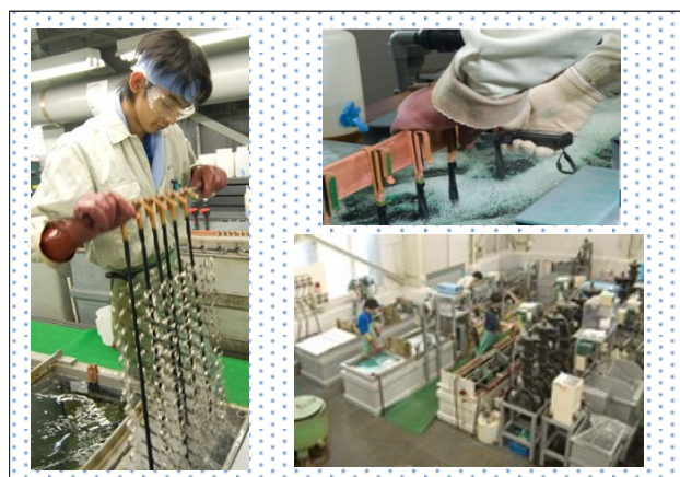
作業現場の様子：めっき製造